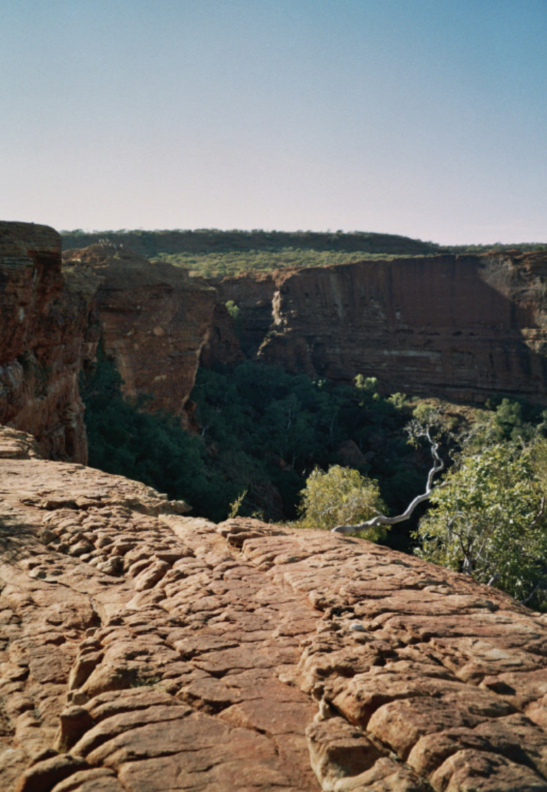
Vom Wind in Wellen geschliffene Felsformationen im Northern Territory