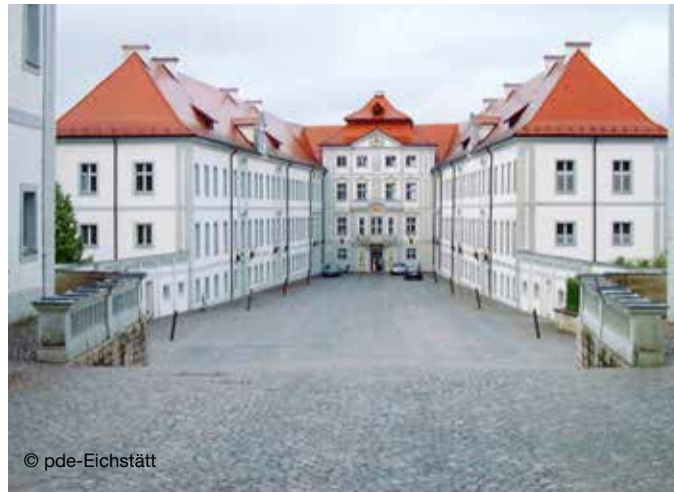
Tagungshaus Schloss Hirschberg Hirschberg 70 92339 Beilngries