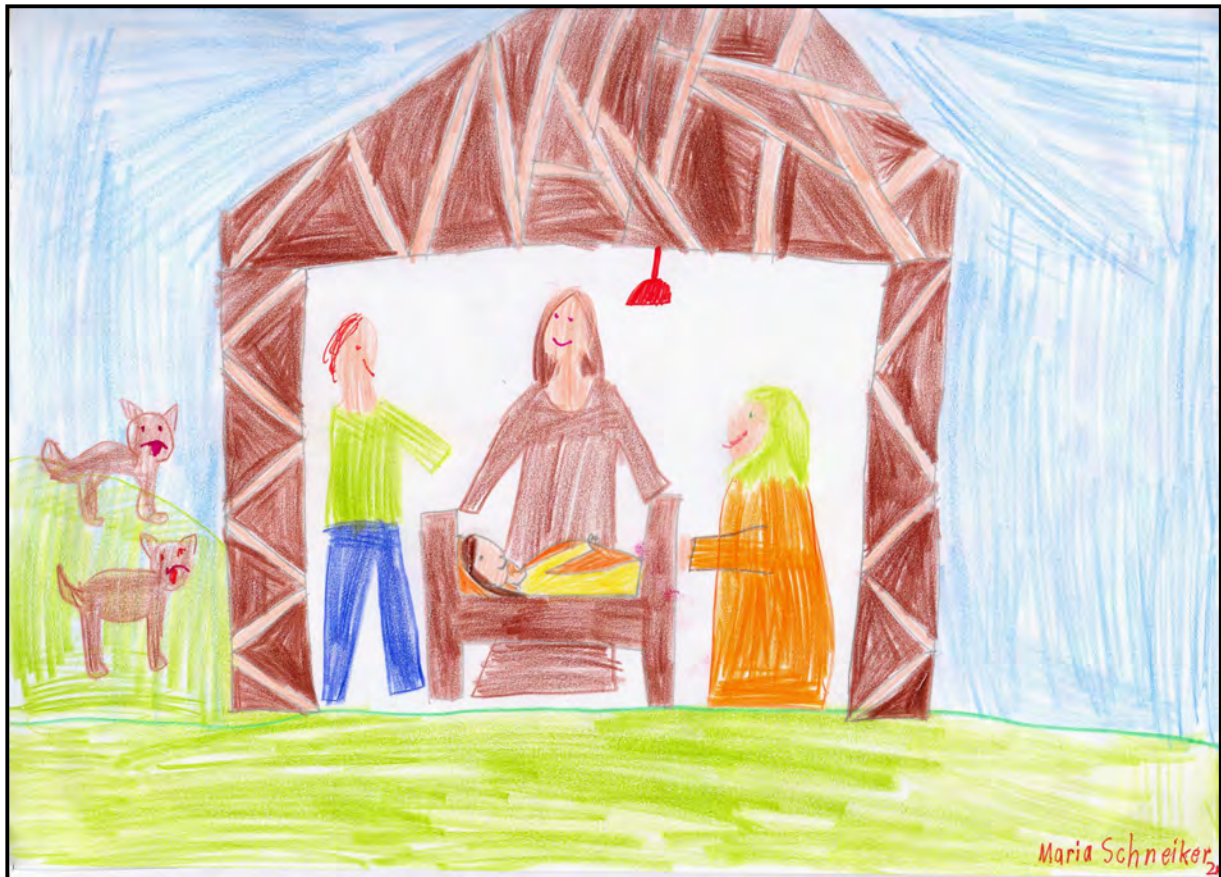
Walburga lebt in Gottes Herrlichkeit: