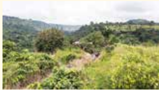
Das weltwärts-Programm bietet nun auch die Möglichkeit, an einem ökologischen Projekt in Ghana mitzuwirken.

Eichstätt. (pde vom 01.03.2021) – Mit dem Weltfreiwilligendienst weltwärts ins Ausland: Dafür sucht das Bistum Eichstätt junge Menschen, die sich in Indien oder Ghana engagieren wollen. Neben verschiedenen sozialen Projekten in Indien gibt es nun auch die Möglichkeit, an einem ökologischen Projekt in Ghana mitzuwirken. Bis Sonntag, 14. März, können sich Interessierte zwischen 18 und 28 Jahren bewerben.