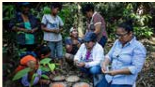
Die Menschen in Bolivien stehen im Mittelpunkt der diesjährigen Misereor-Fastenaktion.

Die Videokonferenzen finden über die Videokonferenz-Plattform »Zoom« statt. Für alle Termine ist eine vorherige Anmeldung erforderlich. Nähere Information und Anmeldeadressen für die jeweiligen Veranstaltungen: www.bistum-eichstaett.de/weltkirche . Informationen auch unter weltkirche(at)bistum-eichstaett(dot)de oder per Tel. (08421) 50-677.