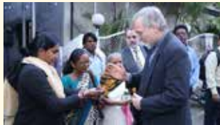
2016 besuchte Bischof Gregor Hanke die nun stark von der Corona-Pandemie betroffene indische Partnerdiözese Poona.

Das Referat Weltkirche der Diözese Eichstätt ruft zur Hilfe für die Menschen in Indien auf. Spenden unter dem Stichwort »Corona-Poona« können auf das Konto der Weltkirche bei der LIGA Bank getätigt werden. IBAN: DE98 7509 0300 0007 6012 20.